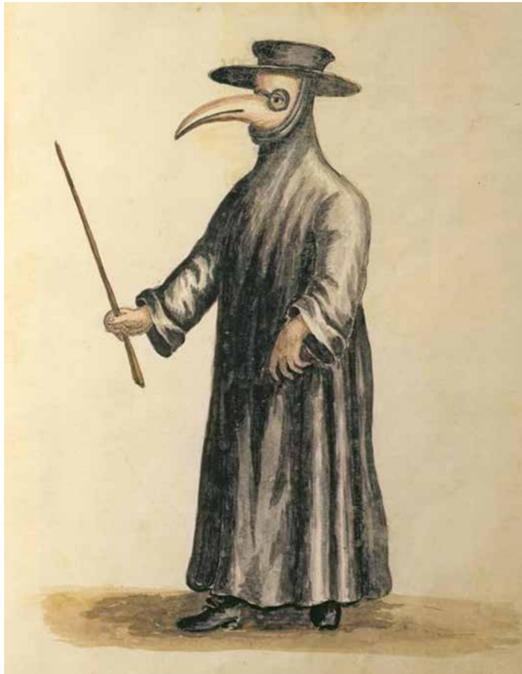
Een pestdokter met een vogelmasker met twee kijkgaten. Het masker zou gevuld geweest zijn met kruiden en specerijen om de lucht te zuiveren. De houten stok gebruikte hij om de zieken te kunnen onderzoeken zonder ze aan te raken.

Joren Vermeersch schreef in zijn epiloog van zijn thesis, academiejaar 2014-15 over "De Zwarte Dood in Vlaanderen" het vol-