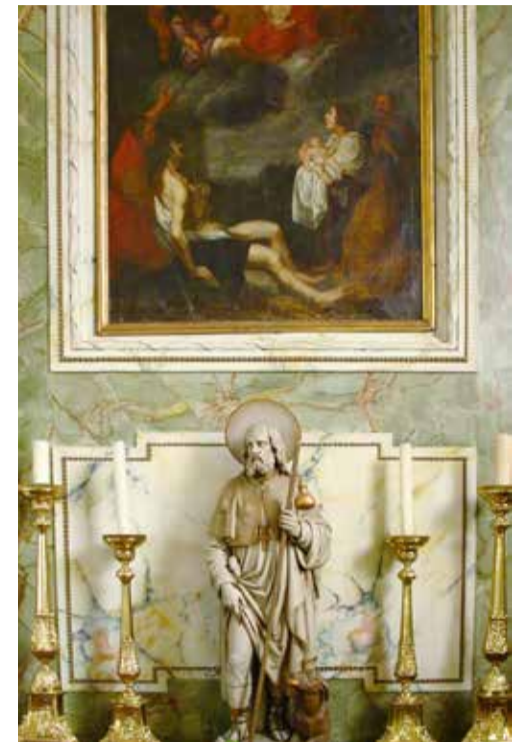
Op het rechtse zijaltaar van de kerk van Schorisse staat het beeld van de H. Rochus in geverfd hout uit 1866-67. Het schilderij "De pestlijders aanroepen de HH. Rochus, Sebastiaan en Antonius abt", uit de 17 de eeuw, meet 150 cm x 120 cm en is ongetwijfeld afkomstig van het voormalige altaar van de vroegere kerk.

Maarke werd in 1832 getroffen door de cholera. Meer informatie is hiervan te vin-