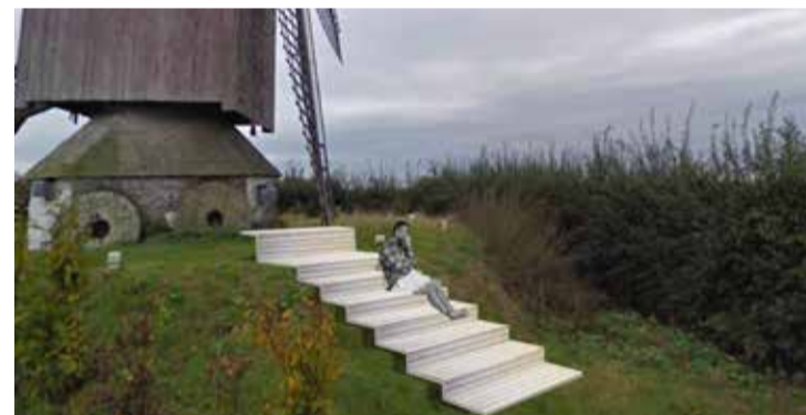
De houten trap aan de Bossenaremolen

Z+, een wedstrijd voor vormgevers gelinkt aan het bijzondere landschap in onze gemeente, begint stilaan vorm te krijgen. Op een 5-tal plaatsen in ons prachtige landschap worden zitobjecten geplaatst die een unieke zitplaats moeten bieden aan wandelaars en fietsers en die hen een extraatje biedt tijdens de stop onderweg. De voorbije maanden werden de winnende vormgevers in contact gebracht met plaatselijke ambachtsslui die instonden voor de realisatie van de ontwerpen. Dit voorjaar werd het eerste object reeds afgewerkt. Langs een trage weg aan de