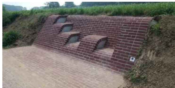
Een tapijt van bakstenen op de trage weg aan de Donderij