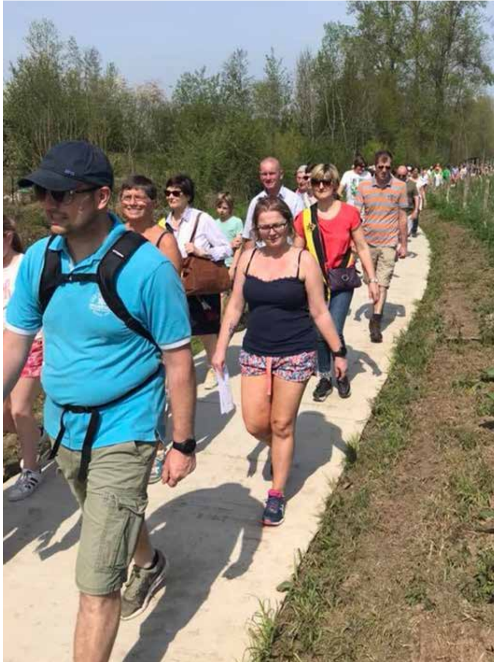
Opening van het Hollebeekpad, onder een stralende zon en grote belangstelling