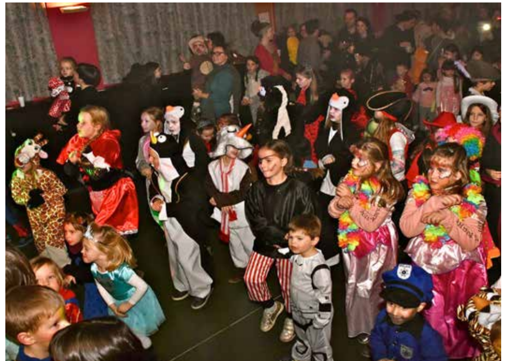
Voor de vijfde keer op rij werd de kinderfuij een succes!

Ook de kinderen kwamen opnieuw aan hun trekken op Zotte Zaterdag, 6 januari. Omdat wij het belangrijk vinden dat deze mooie traditie niet verloren gaat, werd er reeds voor de 5de keer op rij een kinderdiscofuij georganiseerd. Het werd ook dit jaar opnieuw een geslaagde afsluiter, waar een 100-tal kinderen zich kwamen uitleven nadat ze overdag van huis tot huis waren gaan zingen, in ruil voor een cent en een snoepje,