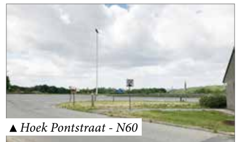
▲ Hoek Pontstraat - N60