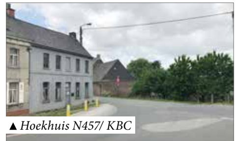
▲ Hoekhuis N457/ KBC