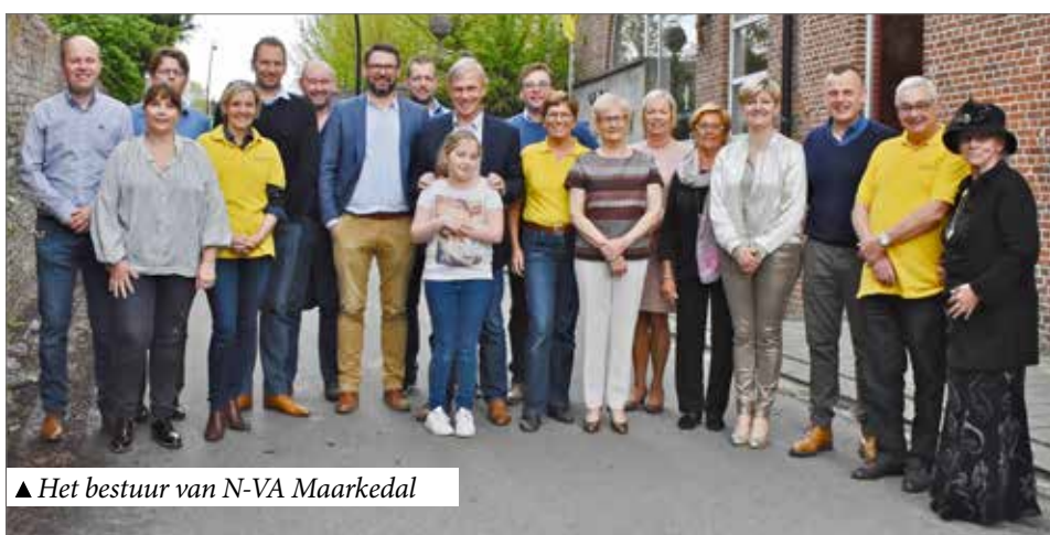
▲ Het bestuur van N-VA Maarkedal