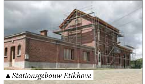
▲ Stationsgebouw Etikhove

#MooierMaarkedal: geen loze slogan. En er zijn ongetwijfeld nog hoekjes en kantjes die beter kunnen. Als u een idee hebt, laat het dan zeker weten. Dat kan via het volgende adres: burgemeester@maarkedal.be