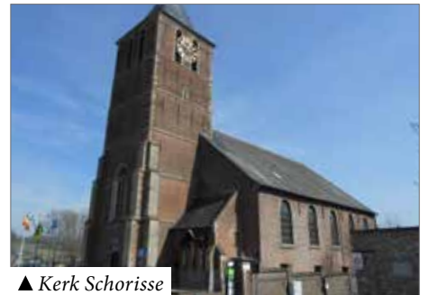
▲ Kerk Schorisse