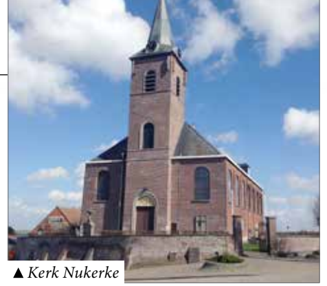
▲ Kerk Nukerke

De gemeente staat ervoor garant dat – ook wanneer de kerken een nevenbestemming vinden – ze als gebouw en als dorpsgezicht moeten behouden blijven. Ze kunnen dus niet gesloopt of verbouwd worden. Het plan is een moedig compromis waarbij verantwoordelijk wordt omgesprongen met publieke middelen mét respect voor het lokale geloofsleven en de Christelijke traditie. Een resultaat waar alle betrokken trots mogen op zijn.