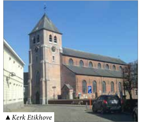
▲ Kerk Etikhove