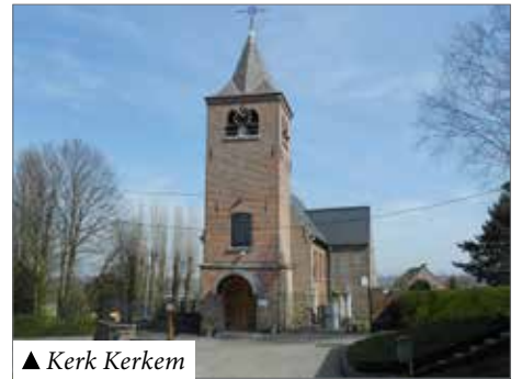
▲ Kerk Kerkem