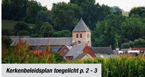
Kerkenbeleidsplan toegelicht p. 2 - 3